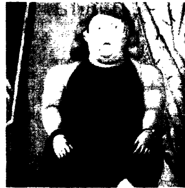
Ciccione Un quadro di Botero